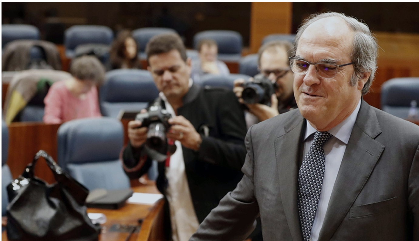
El exministro y diputado del PSOE en la Asamblea de Madrid Ángel Gabilondo

El grupo parlamentario del PSOE-M en la Asamblea de Madrid ha sugerido a Cándido Conde Pumpido para ocupar una de las cuatro plazas de magistrado del Tribunal Constitucional, una propuesta que se votará en el Pleno de este jueves y que, de aprobarse, se debatirá en el Senado junto con otros candidatos.