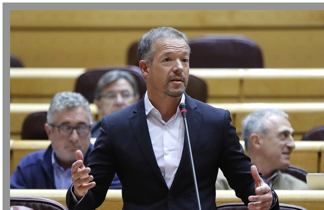
El senador del PSOE Andrés Gil García, durante su intervención en el Senado

El senador socialista Ander Gil pidió ayer al presidente del Gobierno, Mariano Rajoy, que exija "respeto y dignidad" para el pueblo mexicano al presidente de los EEUU, Donald Trump, en la conversación telefónica que por la noche mantendría con él. Gil expresó este requerimiento en la sesión de control del Senado, a través del ministro de Asuntos Exteriores, Alfonso Dastis, al que reclamó respuestas diplomáticas ante las polémicas