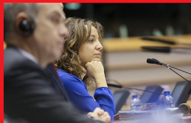
La eurodiputada socialista Iratxe García Pérez, en el Parlamento Europeo

La eurodiputada socialista Iratxe García Pérez, en el Parlamento Europeo, ha reclamado, una vez más, una solución para los trabajadores de Lauki, ante representantes de los sindicatos regionales de UGT y CCOO. En dicha reunión han acordado firmar una carta para remitir a la multinacional Lactalis para que ésta cumpla con lo acordado después del cierre de Lauki. A petición de Iratxe García, los eurodiputados