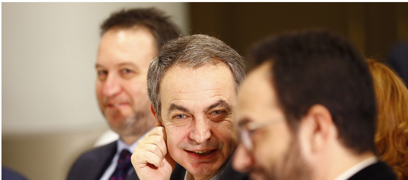
El expresidente del Gobierno español José Luis Rodríguez Zapatero