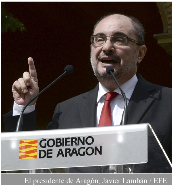
El presidente de Aragón, Javier Lambán