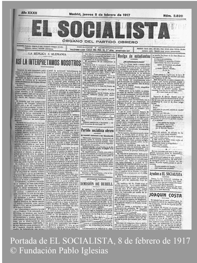
Portada de EL SOCIALISTA, 8 de febrero de 1917