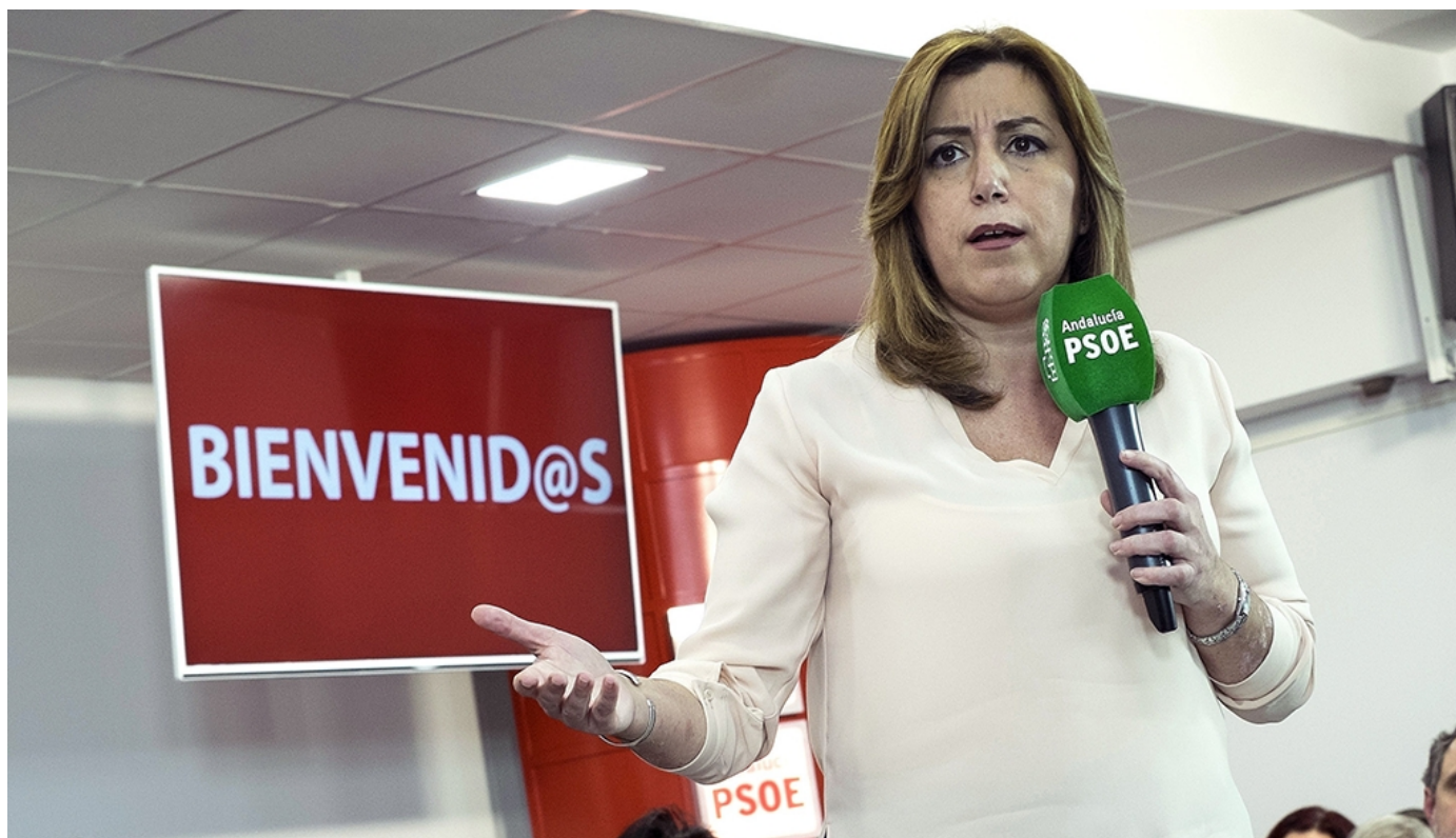
La secretaria general del PSOE andaluz y presidenta de la Junta, Susana Díaz, en Huelva