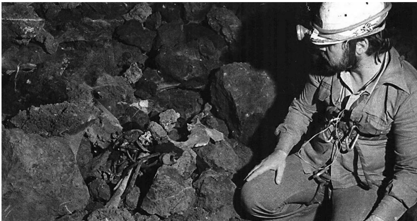
Restos de una mujer "caída" en la Sima