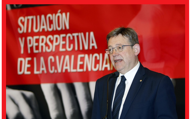
El President de la Generalitat Valenciana, Ximo Puig, durante su conferencia

El President de la Generalitat, Ximo Puig, ha apostado por establecer una agenda política de cohesión territorial para la Comunitat Valenciana, basada en la colaboración institucional y el diálogo, que acompañe a la agenda económica valenciana que está impulsando el Consell. "No concibo que vertebrar la Comunitat Valenciana tenga como vehículo la concentración en un área concreta de los recursos e infraestructuras", aseguró